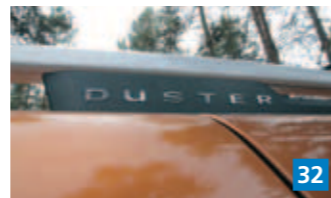
▲ Tosimiesten jokasyksyinen retki Jäämerelle tehtiin tänä vuonna Dacia Dusterilla.