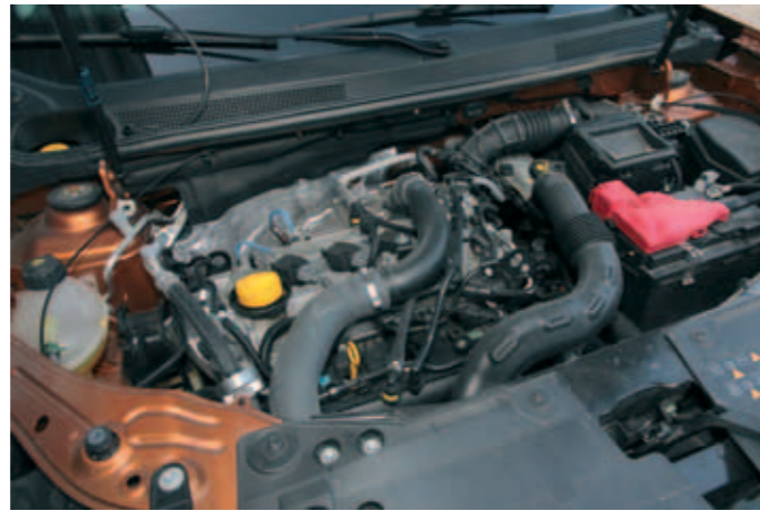
▲ Diesel on möyrii tunnollisesti vaikeammassakin maastossa.