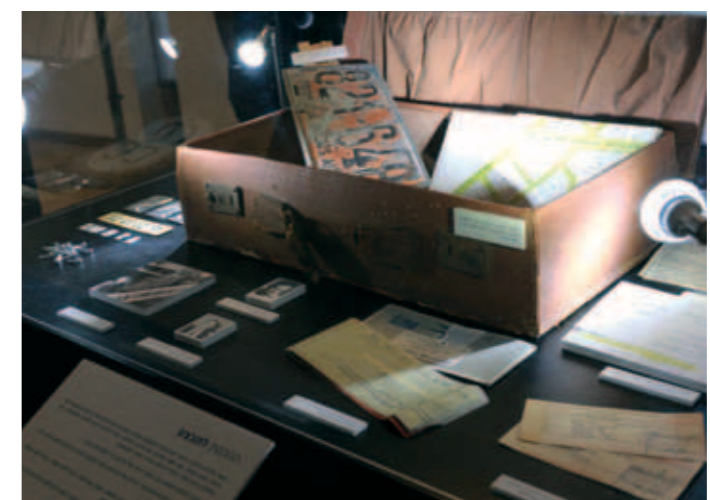
Mossadin käyttämä matkalaukku, joka sisältää erilaisia rekisterikilpiä sekä mm. iskuryhmän käyttämän kartan ja autonvuokraussopimuksen Argentinassa.