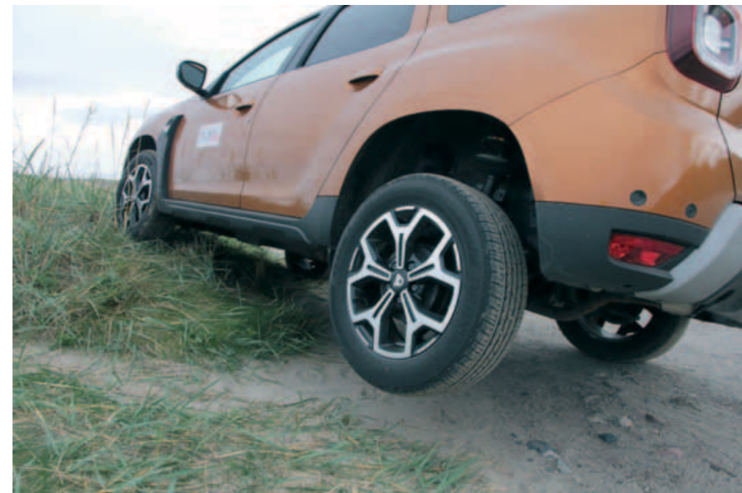
▲ Duster nostaa kevyesti takatassuaan.

Maasto-olosuhteissa auto maattilaatikko olisi toiminut paremmin, vaihdevälitys on ma-