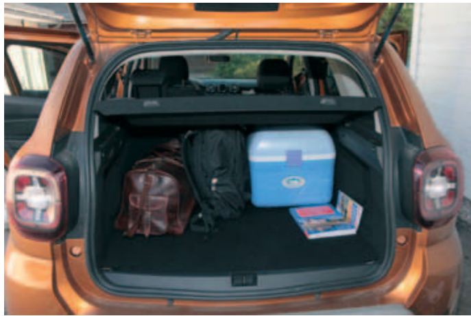
▲ Dusterin tavaratila mukautuu helposti erilaisiin tarpeisiin..