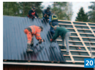
▲ Kristittyjen Miesten Verkoston juhlailemällä Bergvikin kartanossa korjattiin mm. varastorakennuksen kattoa.