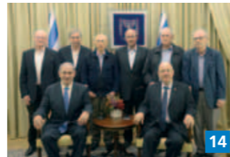
▲ Mossad on varsin mielenkiintoinen työpaikka.