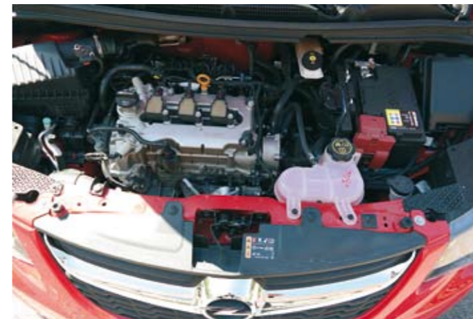
▲ Vaikka tuolla konepellin alla ei mylvi kuin 75 hevosvoimaa, Rocks kuitenkin liikahtaa todella mukavasti.