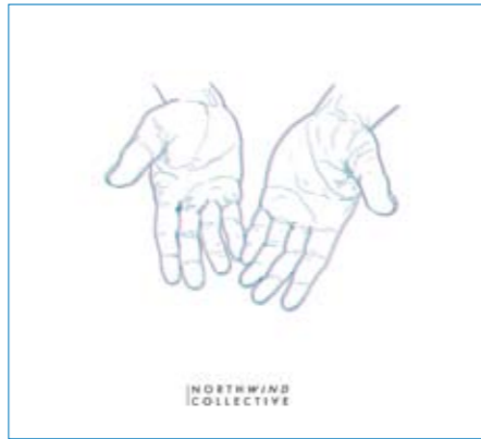
North Wind Collective Isä