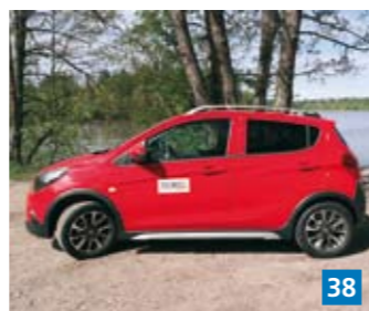
▲ Koejoimme kesän aluksi uuden ns. maastohenkisen Opel Karls Rocksin – pienen ja pirtsakan kaupunkiauton.