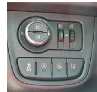
▲ Mukava lisä tässä on kaupunkiajotila, jonka saa päälle City-nappia painamalla. Se keventää ratin pyörittystä varsinkin ah- taissa pysäköintihalleissa tai muutenkin katuliikenteessä.

kin pitkäkoipinen, takapenkki jää pelkkien tavaroiden kuskaukseen.