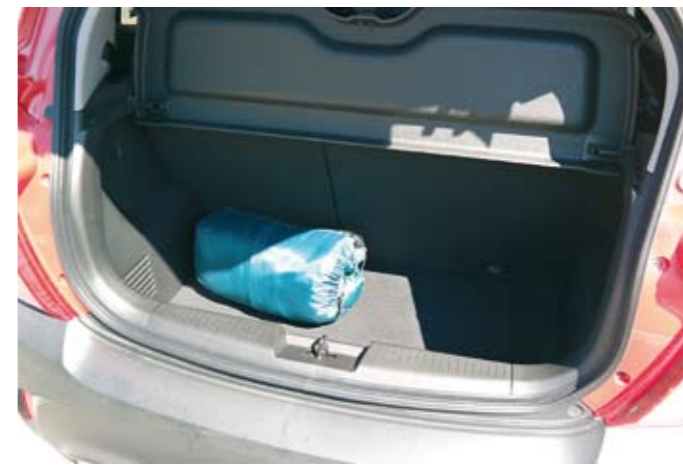
▲ Lastausta hankaloittavat hieman nämä korkeat reunukset, mutta tuskin tämän kokoisella autolla paljon ostoskassoja enempää on tarvekaan kuskailla.