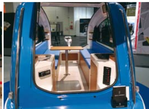
Sealander on vaikkapa eläkeläispariskunnalla sopiva matkailuvaunu, joka kulkee kätevästi auton perässä ja jonka saa muutettua kädenkäänteessä merikelpoiseksi.