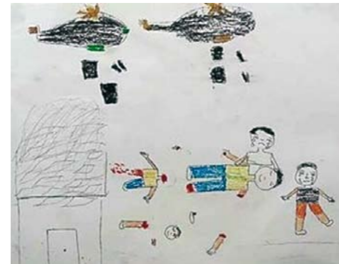
▼ Lastenpiirros Syyriassa käytetyistä tynnyripommeista.

neita kohtaan on kansainvälisen median täysi vaikeneminen asiasta. On tuhansia syyrialaisia jotka ovat kiitollisia Israelille saamastaan avusta, mutta he eivät voi julkisesti sitä tuoda esille. Avun saaneet ovat kuitenkin perustaneet webbi-sivun ”Thank You Am Israel”, joissa julkisesti kiittävät saamastaan avusta Israelin puolella rajaa.