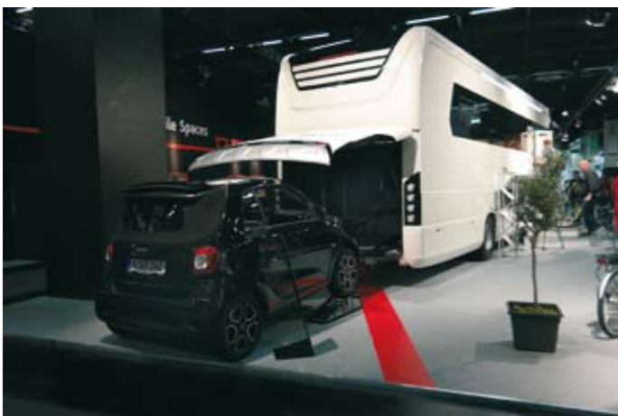
Morelo Empireliner on luksusainen matkailuauto, jossa asustetaan monen kotiolojakin hulpeammalla tasolla. Mukana kulkee kätevästi myös ostoksien tekoon soveltuva pienempi auto. Pituutta Morelolla on 11,50 m, leveyttä 2,50 m ja korkeuttakin 3,70 m.

Siinä missä kevytrakenteet soveltuvat rullaaaviin, kelluviin tai vaikkapa lentäviin tiloihin, samoja