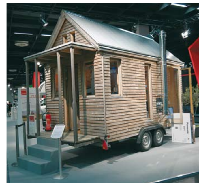
Tiny House tarjoaa monia mahdollisuuksia olipa sitten kyseessä vieraiden majoitus takapihalla, kalastus- tai metsästysretki tai vaikkapa mukana kulkeva toimistoratkaisu.