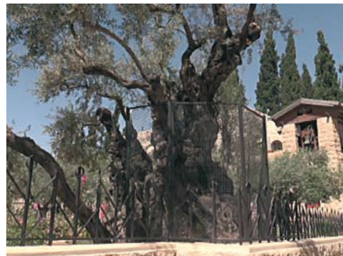
▲ Getsemanen öljypuu ehkä Jeesuksen ajoilta.

don, vaan niin kuin sinä. Hän tapasi opetuslapset nukkumasta ja sanoi Pietarille: "Ettekö te edes hetken vertaa jaksaneet valvoa kanssani? Valvokaa ja rukoilkaa, ettette joutuisi kiusaukseen. Tahdotta ihmisellä on, mutta luonto on heikko." (Matt.24)