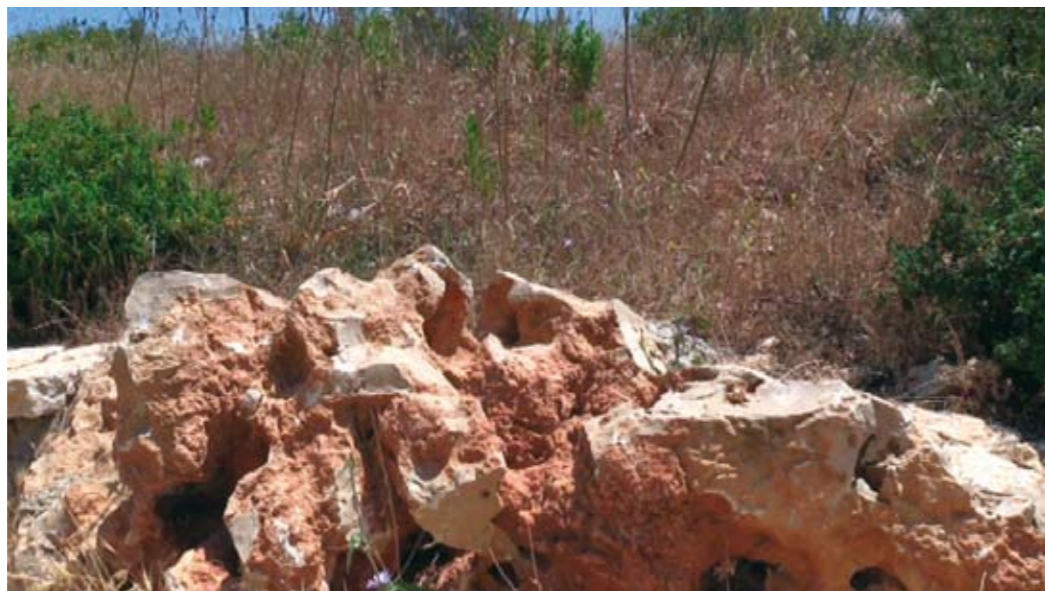
▲ Jumalan kivi Karmelilla.