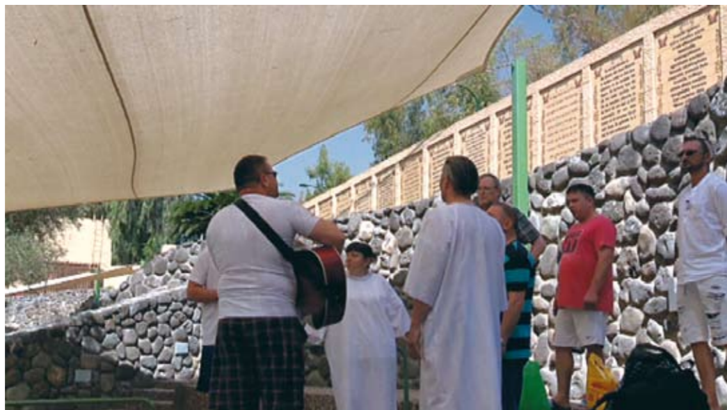
▲ Kasteella Jordanilla.

Aamurukouksessa pyysimme opastusta Betesdan lammikon pääsemiseksi. Menimme Jerusalemin kapeita katuja ja vuorenrinteitä sinnepäin, missä lammikon pitäisi olla. Siellä oli poliisiauto tien mutkassa. Kysyimme hänel-