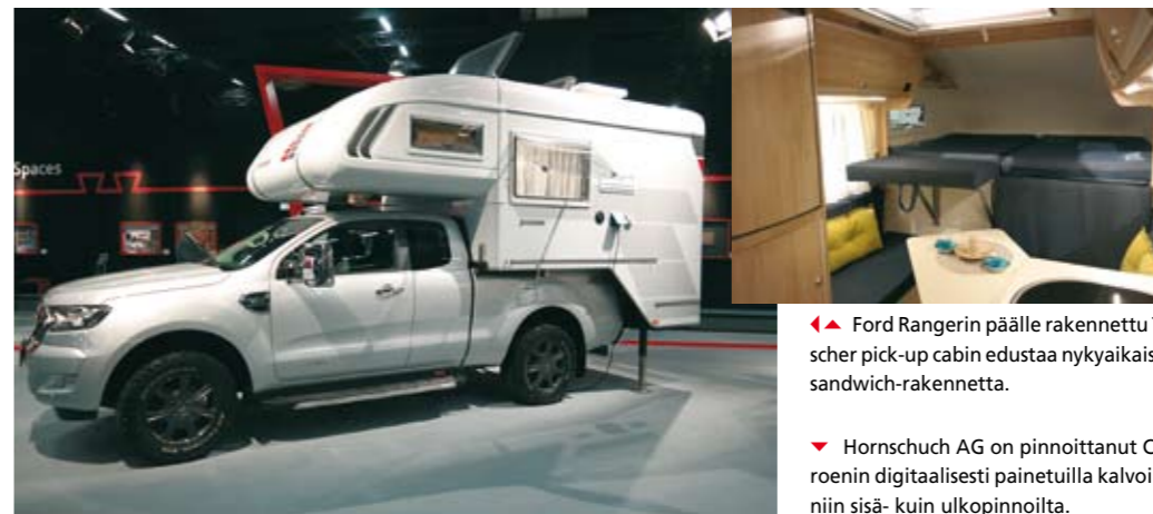
Ford Rangerin päälle rakennettu Tischer pick-up cabin edustaa nykyaikaista sandwich-rakennetta.