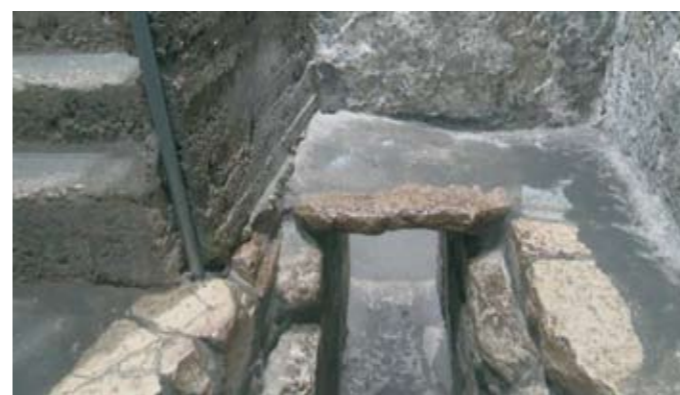
▲ ▼ Lasaruksen haudan suuaukko.

Tällä paikalla nyt seisomme, ja tässä on näkyvä edelleenkin kiviä, jotka ovat niin kuin tuliperäisestä maastosta tulleita. Ympäristössä niitä ei ole.