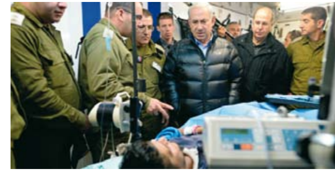
◀ Pääministeri Benjamin Netanyahu vieraillessaan IDF:n kenttä sairaalassa Golanilla.

Mielenkiintoista tässä juutalaisvaltio Israelin auttamistyössä Syyrian sisällissodan haavoittu-