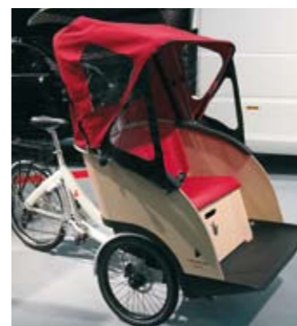
Sähköavusteinen Triobike TAXI on suunniteltu vanhemman väestön kuljetuksiin. Muotopuristettu pyökkiviilu istuin antaa pyörälle mukavan ilmeen.

Mutta olihan suihkuseinäkkin aitoa lasia ja pesutilan lattia luonnonkiveä.