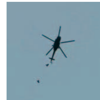
▲ Tynnyripommi putoaa helikopterista.

Vaikka presidentti al-Assad, lääkärin koulutuksen omaava maan presidentti, kieltää tynnyripommiin käytön, on niistä kiistatonta näyttöä runsaasti. Näyttöä löytyy mm. Alepposta, Homsista ja tuoreimpana 2018 Itä-Ghoutassa, kun Syyria il-