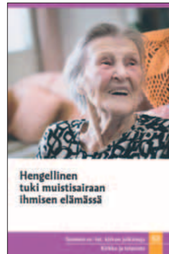
Hengellinen tuki muistisairaana ihmisen elämässä Suomen ev.-lut.kirkon julkaisuja 63 Kirkkohallitus, 2018

Muistisairaana ihmisen kohtaamisessa myönteisyys on tärkeää. Tervehdi kädestä, hymyile