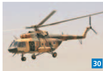
▲ Helikopterista pudotettavista tynnyripommeista ei juurikaan puhuta, vaikka ne alkukantaisuudessaan ovat aikaansaaneet paljon kuolonuhreja Syyrian siviilien keskuudessa.