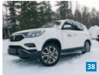
▲ Viimeisillä lumilla pääsimme testaamaan uudistunutta SsangYong Rextonia.