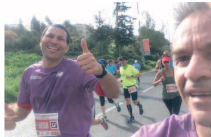
► Suomi-Israel yhteys syntyi.