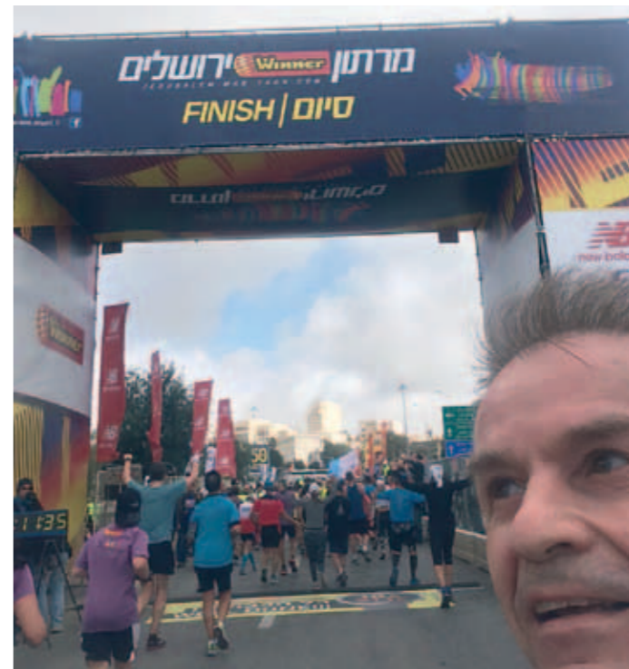
▼ Finnish ja finish.

Maratonin maalissa saat itsellesi sen, jota tavoittelit, olet voittaja, selviytyjä ja mitalikin ripustetaan kaulaan. Onnen tunne on hieno. Näin on myös varmaa, kun saamme nähdä lopullisesti