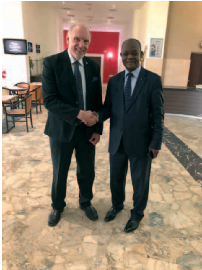
▲ Ministeri Koffi Esaw, Togo.