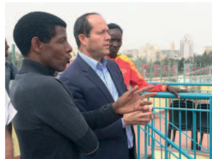
► Pormestari esitteli Jerusalemin maamerkkejä etiopialaislegendalle.

1.KOR 9: 23-27: ”Mutta kaiken minä teen evankeliumin tähden, että minäkin tulisin siitä osalliseksi. Ettekö tiedä, että jotka kilparadalla juoksevat, ne tosin kaikki juoksevat, mutta yksi saa voittopalkinnon? Juoskaa niin kuin hän, että sen saavuttaisitte. Mutta jokainen kilpailija noudattaa itsensähillitsemistä kaikessa; he saadakse vain katoavaisen seppeleen, mutta me katoamattoman. Minä en siis juokse umpimähkään, en taistele niin kuin ilmaan hosuen, vaan minä kuritan ruumistani ja masennan sitä, etten minä, joka muille saarnaan, itse ehkä joutuisi hyljättäväksi.”