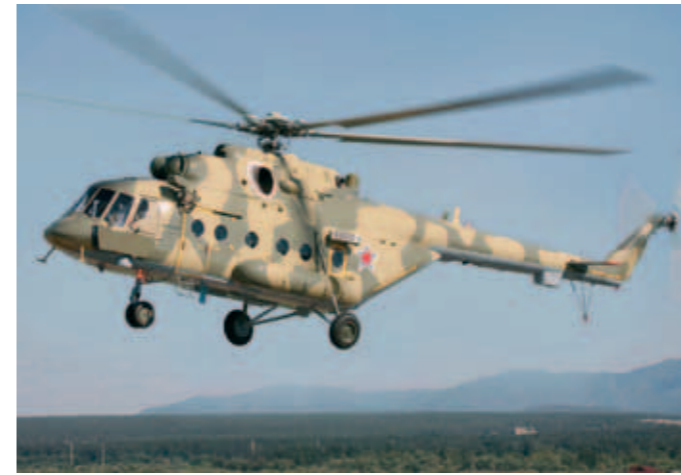
▲ Venäjän armeijan Mi-17.

Tynnyripommit tuhoavat epätarkkuutensa vuoksi kapinallisalueiden infrastruktuurin ja