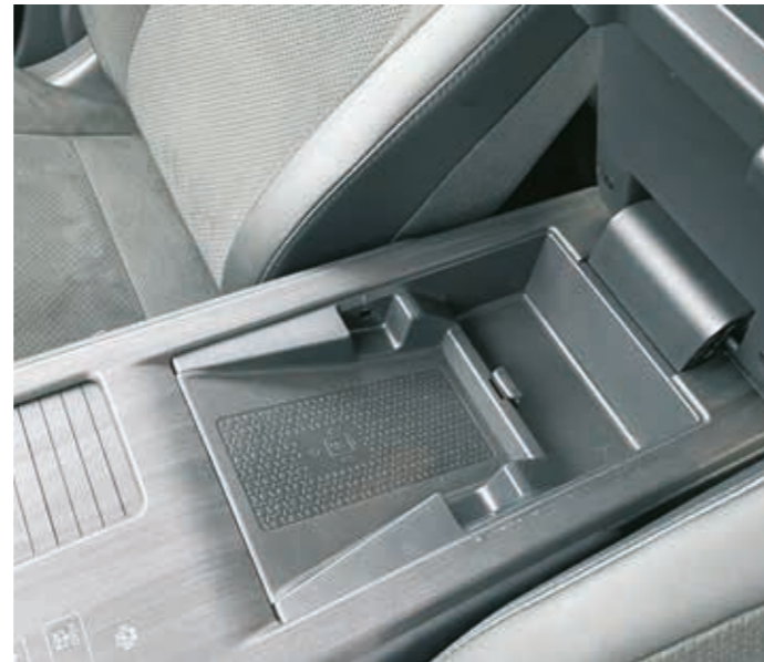
▲ Kännykän latauspaikka löytyy käsinojan kannen alta, mikä ei välttämättä ole ihanteellinen paikka sille.

ns. haptisina kytkiminä. Nämä kytkimet tarjoavat samanlaisen tunteen kuin mekaaniset kytkimet, ne reagoivat kosketukseen eli kun toiminta kytketään, kytkimen kohta antaa sormeen värähdyksen merkiksi toiminnan aktivoitumisesta. Talvitumput kourassa tämä ei tietenkään onnistu. Osa kytkimistä, kuten esimerkiksi äänenvoimakkuuden säädin samoin kuin ohjauspyöräkatkaisimet pysyvät fyysisinä. Ariyalla ajaminen on todella pehmeää ja hiljaista. Kuski voi valita kolmen eri ajotilan välillä, Standard, Sport sekä Eco. Standard-moodi on ehdottomasti paras valinta, sillä ecolla ajaminen menee aika rasittavaksi