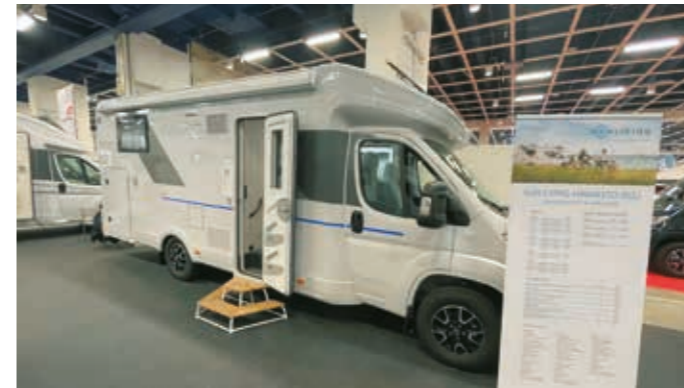
▲ Slovakialaisen Adrian edullisempi Sun Living -brändi tekee vauhdilla paluuta Suomen markkinoille. Alustana toimii Citroen Jumper.