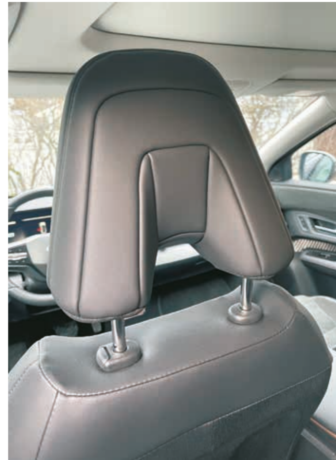
▲ Niskatukien muotoilu on näppäränoloinen.