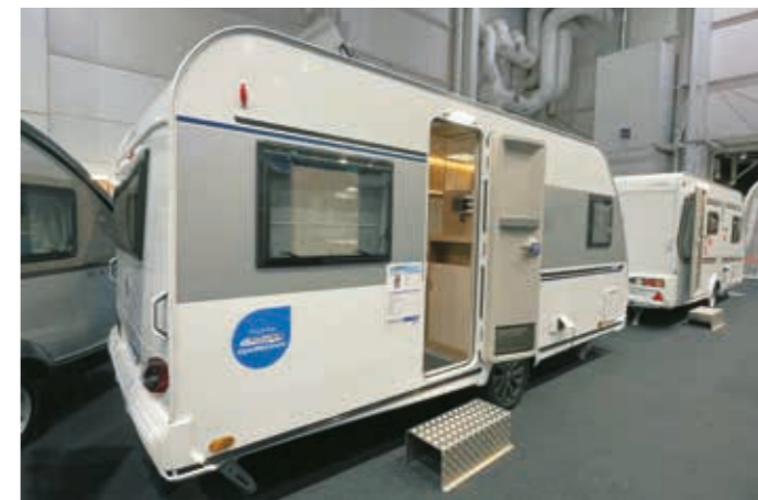
▶ Knaus Sport 450 FU e-Power on ensimmäinen täyssähköinen matkailuvaunu.