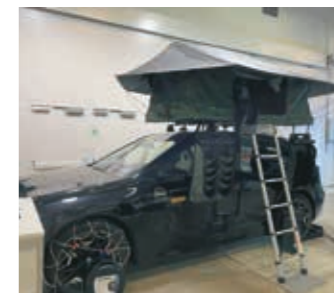
▶ Thulelta löytyy useimpiin automalleihin soveltuvia kattoteltoja – niin poikittain kuin pitkittäinkin nukuttavia.