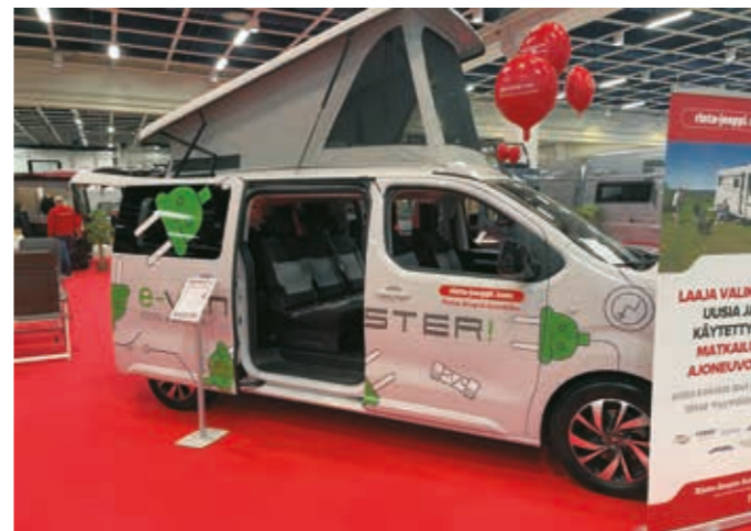
▶ Pienten retkeilyautojen kysyntä kasvaa Keski-Euroopassa monikäyttöisyytensä takia. Pössl esitteli messuilla Citroën Spacetourer -tila-autosta rakennetun täyssähköisen e-Vansterin käteväällä nostokatolla.