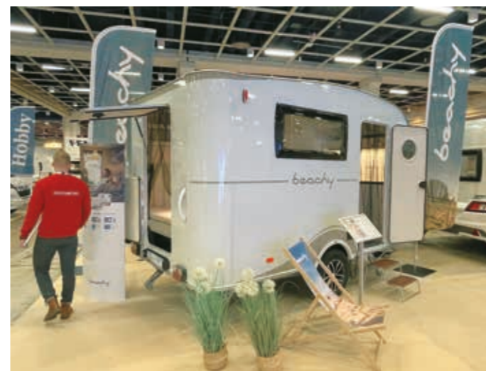
▼ Pienemmän vetokyvyn omaavat sähkö- ja hybridautot ovat saaneet myös pienempien vaunukokojen yleistymisen. Tässä näppärä Hobby Beachy 360. Makuupaikkoja kahdelle aikuiselle ja yhdelle lapselle. Hintaa 16 990 euroa.

minen koetaan kalliiksi. Nuoret aikuiset suhtautuvat pääasiassa avoimesti ja kiinnostuneesti matkailuajoneuvoihin ja nostavat vetoimatekijöiksi erityisesti vapauden, riippumattomuuden, matkanteon helppouden, etätymämahdollisuudet sekä omien tavaroiden vaivattoman kulkemisen mukana. He tarvitsevat kuitenkin enemmän tietoa matkailuajoneuvoilla matkustamisesta.