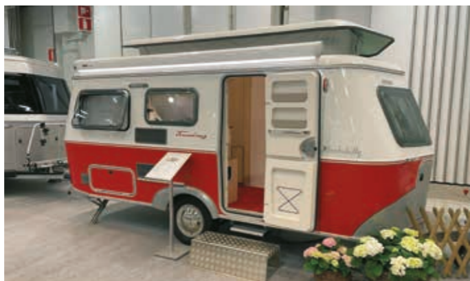
▶ 36 870 euroa maksavassa hilpeänoloisessa Eriba Touring 530 Rockabillyssä on vuodepaikat kolmelle

Kotimaan matkailusta on tullut entistä suosittuun viime vuosina, etätyömahdollisuudet ovat lisääntyneet ja vapautta arvostetaan entistä enemmän. Matkailuautolla, -vaunulla tai retkeilyautolla matkustaminen on omatoimimatkailua parhaimmillaan.