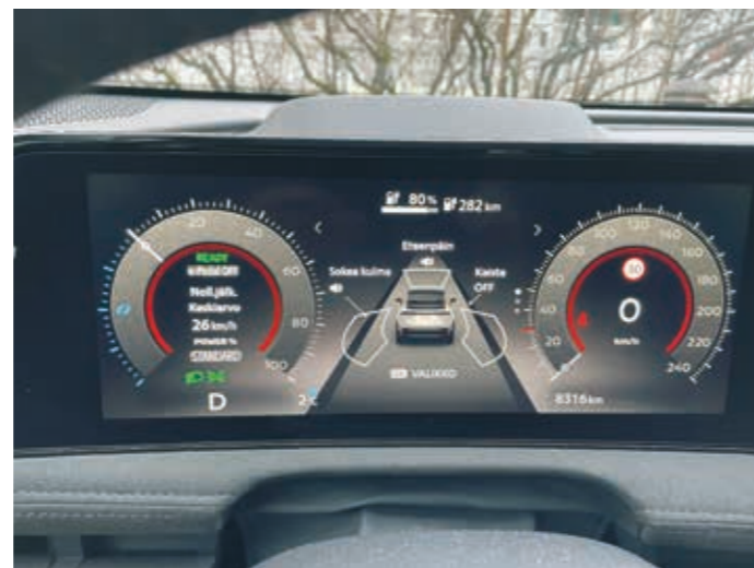
▲ Mittaristosta löytyy runsaasti erilaista tietoa.

11 metrin paikkeilla liikkuva kääntösäde mahdollistaa Ariya pyörittelyn ahtaissa paikoissa varsin mukavasti.