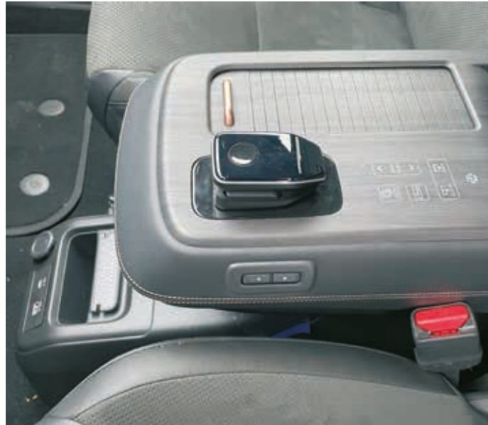
▲ Sähköisesti siirtyvä käsinoja on kätevä yksityiskohta, ja sillä saadaan maksimoitua takana istuvien jalkatila.