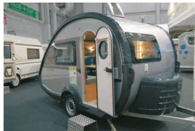
▶ Saksalainen T@B 320 Basic maksaa 21 530 euroa. Siinä on vuodepaikat kahdelle, 60-litrainen jääkaappi ja 2-liekkinen liesi-allasyhdistelmä lasikannella. Ja koska painoa on alle 750 kg, vaunu liikaahtaa pienemmällekin vetoautolla.

nomadismista puhutaan, kun asutaan vakituisesti paikkariippumattomasti matkailuajoneuvossa. Matkailuajoneuvojen myynti ei yltänyt vuonna 2022 huippuvuoden 2021 lukuihin, mutta trendi alalla on positiivinen. Matkailuajoneuvot kiin-