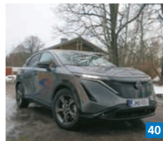
▲ Nissanin täyssähköuutuus Ariya osoittautui todella miellyttäväksi ajettavaksi lehden koeajossa.