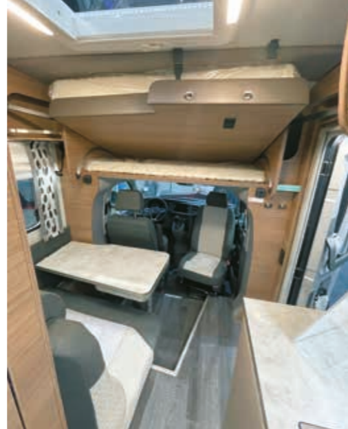
▶ Auton perällä sijaitsevien kahden makuupaikan lisäksi ohjaamon päältä laskeutuu toiset kaksi makuupaikkaa.