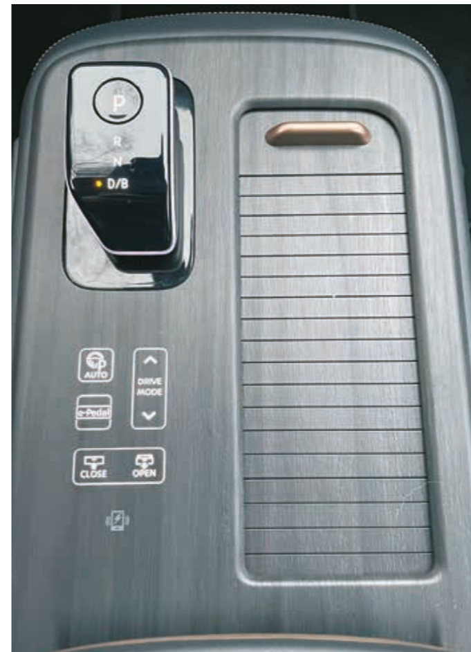
▼ Käsinojan päälle on automaattivaihteiston valitsimen lisäksi sijoitettu joitakin säätimiä, joiden käyttö ainakin auton liikkussa oli hieman hankalaa.