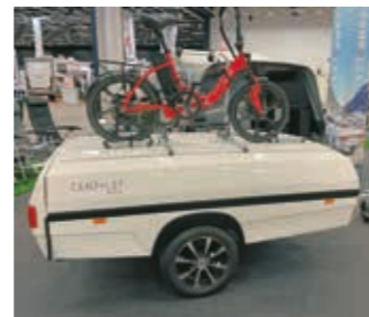
▶▶ Camp-Let North -telttavaunu on hyvä valinta, kun haluaa kokea luonnon 1. luokassa. Integroitujen tankojen ansiosta voi Camp-Let Northin pystyttää ja purkaa muutamalla yksinkertaisella toimenpiteellä. Jarruton perusvaunu ilman lisävarusteita kustantaa 8 875 euroa ja jarrullinen 9 920 euroa.

nomadismista puhutaan, kun asutaan vakituisesti paikkariippumattomasti matkailuajoneuvossa. Matkailuajoneuvojen myynti ei yltänyt vuonna 2022 huippuvuoden 2021 lukuihin, mutta trendi alalla on positiivinen. Matkailuajoneuvot kiin-