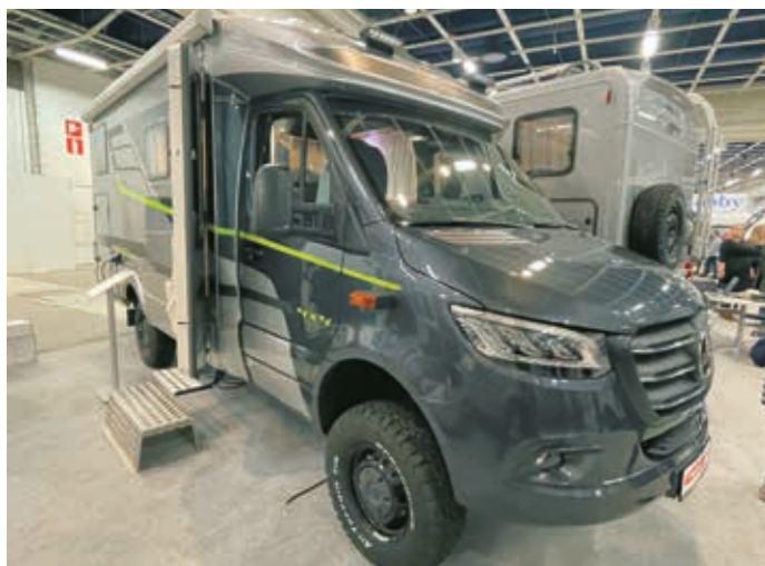
▼ Vaativampaan tosimmäiseen menoon oli tarjolla puoli-integroitu Hymer ML-T 570 Cross Over. Jatkuva nelivetoinen 190 hevosvoiman moottori ei pelästy pienäkään kannokkoa. Valmistaja lupaa autolle 10 päivän omavaraisuuden, vesitankkiin mahtuu 100 litraa vettä. Hintaa autolla 163 000 euroa.