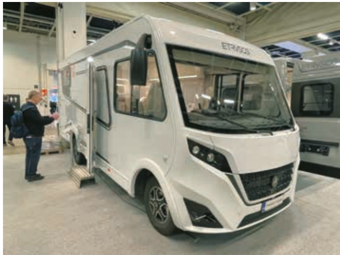
▲ Ensimmäistä kertaa messuilla Suomessa esittäytyi Freedom Factoryn maahantuoma Etrusco. Fiatin alustalle rakennettu Etrusco I6900 5B:n perushinta on 74 600 euroa, mutta messuilla esitellyillä varustella 89 510 euroa.