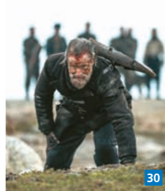
▲ Sisu on hermoja raastava toimintaelokuva toisesta maailmansodasta, jossa yksi mies taistelee natsien tuhopartiota vastaan Lapin erämaassa.