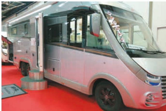
▼ Carthago chic e-line 64 XL QB on Carthago liner -luokan kruununjalokivi. Mercedes-Benz Sprinterin alustalle rakennetussa 9-metrissä autossa on neljä vuodepaikkaa. Yhtenä erikoisuutena 211 cm asuintilan sisäkorkeus, joten matkailuauto soveltuu myös koripalloilijoille... Hintaa ilman toimituskuluja 244 980 euroa.

lopussa. Matkailuvaunut antavat kuitenkin hyvää vastusta, sillä ensirekisteröidyistä matkailuajoneuvoista matkailuvaunuja vuonna 2022 oli peräti 36 % (2021 28,5 %, 2020 30,5 %). Erittäin pienien ja keskisuurten vaunujen kysyntä on selvässä kasvussa.