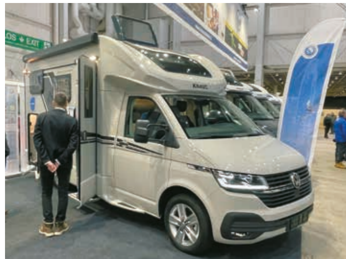
◀ Knaus esitteli Volkswagen Transporter /6.1:n alustalle rakennetun 5,9 -metrisen Knaus Tourer Vanin.