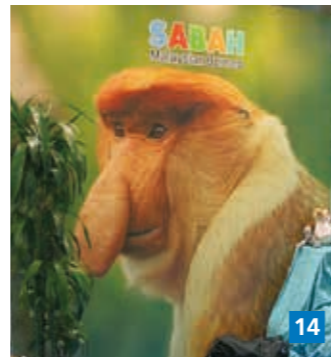
▲ Matka-messut palasi Helsingin Messukeskukseen kolmen koronavuoden jälkeen ja veti matkustushalukasta kansaa messukäytävälle runsain mitoin.