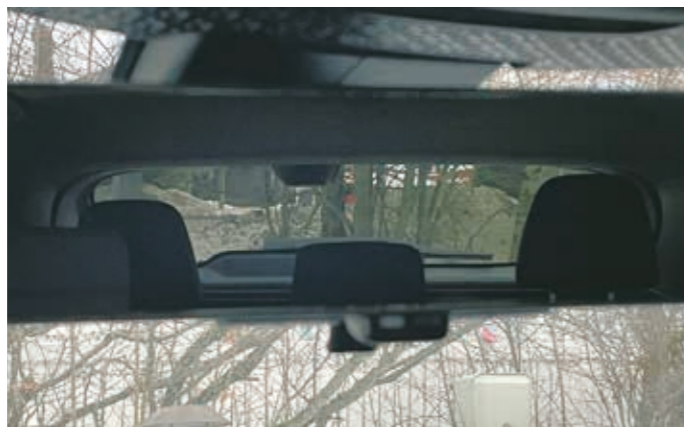
▲ Crossoverin kattolinja sekä takakunnon spoilerit rajoittavat jonkin verran näkyvyyttä taaksepäin.

ns. haptisina kytkiminä. Nämä kytkimet tarjoavat samanlaisen tunteen kuin mekaaniset kytkimet, ne reagoivat kosketukseen eli kun toiminta kytketään, kytkimen kohta antaa sormeen värähdyksen merkiksi toiminnan aktivoitumisesta. Talvitumput kourassa tämä ei tietenkään onnistu. Osa kytkimistä, kuten esimerkiksi äänenvoimakkuuden säädin samoin kuin ohjauspyöräkatkaisimet pysyvät fyysisinä. Ariyalla ajaminen on todella pehmeää ja hiljaista. Kuski voi valita kolmen eri ajotilan välillä, Standard, Sport sekä Eco. Standard-moodi on ehdottomasti paras valinta, sillä ecolla ajaminen menee aika rasittavaksi