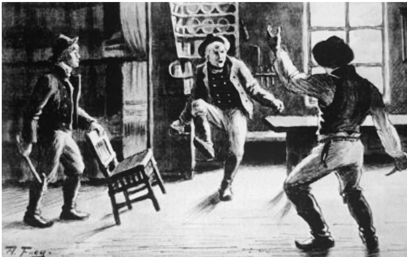
Puukkojunkkarikuva Santeri Alkion kirjasta Puukkojunkkarit