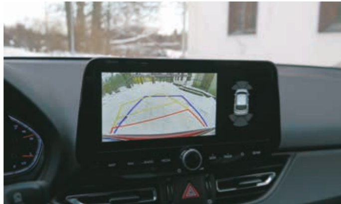
▲ Peruutustutkan kuva on todella tarkka ja kirkas.