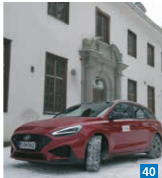
▲ Juhlavuoden koeajot aloitetaan Hyundai i30 Wagonin kevythybridillä.