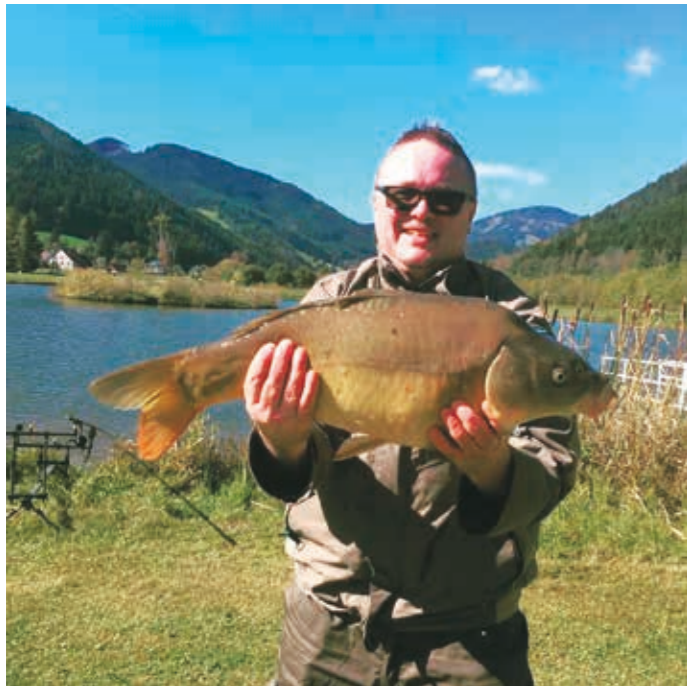
▲ Karppeijahdissa Etelä-Steiermarkissa.