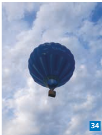
▲ Kuumailmapallolento on mahtava kokemus varsinkin ensikertalaiselle.